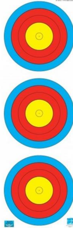
40cm-C Vertical Triple Face (6 – small10) (COMPOUND)