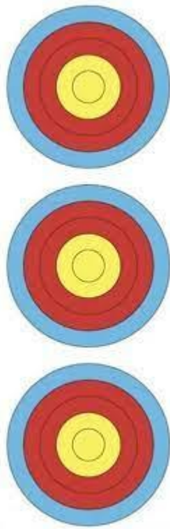
40cm-R Vertical Triple Face (6 – big10) (RECURVE & BAREBOW)